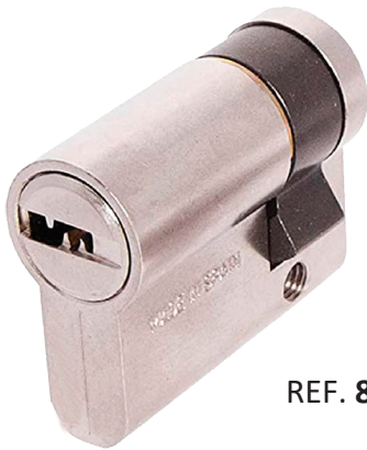
REF. 81251 Llave Puntos