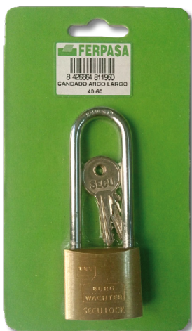
REF. 81195 Candado arco largo 40-60