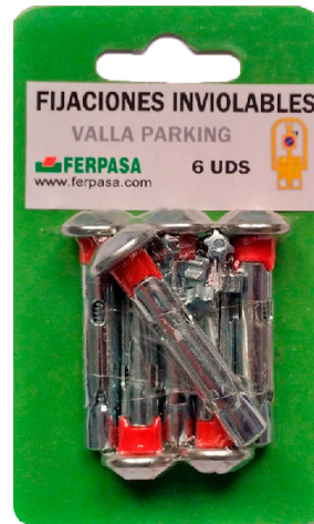
REF. 5922 Fijación Valla x6