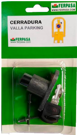
REF. 13103 REF. 13104 Llaves Iguales