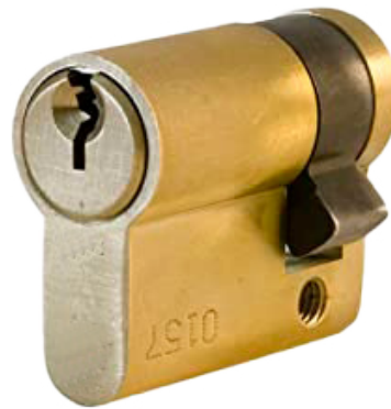
REF. 81250 Llave Serreta